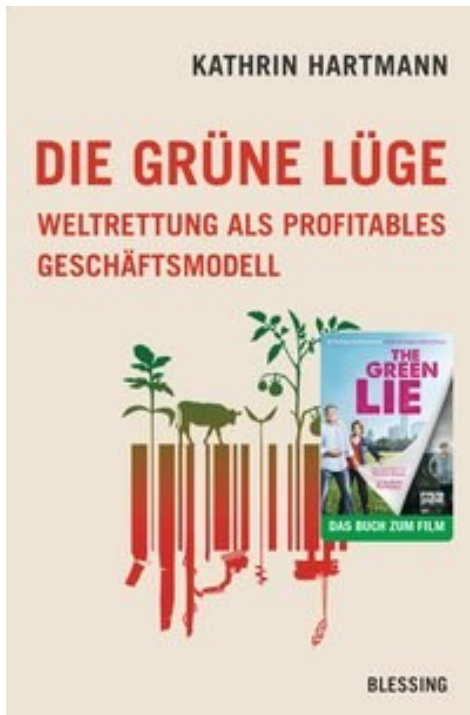
Blessing, München 2018, 249 Seiten ISBN: 9783896676092, 15.00 €

Hans Joachim Schellnhuber ist Gründer und emeritierter Direktor des Potsdam-Instituts für Klimafolgenforschung.