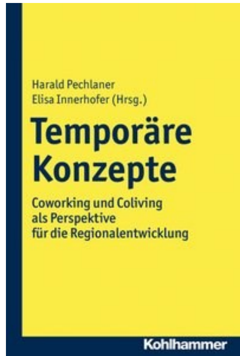
Kohlhammer, Stuttgart 2018, 171 Seiten ISBN: 9783170336704, 49.00 €