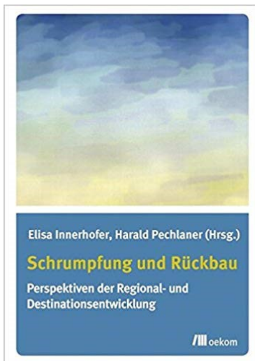
oekom, München 2017, 248 Seiten ISBN: 9783960060185, 24.95 €

Immer deutlicher tritt zutage, dass flächendeckendes Wachstum nicht möglich ist: Boomende Zentren sind ohne ihre Gegenpole nicht zu haben – Wachstum und Rückzug sind zwei Seiten einer Medaille, sie existieren nur mit- und nebeneinander. Was wir daher brauchen, ist eine Debatte über Strategien für Räume, deren Zukunft in wirtschaftlicher oder gesellschaftlicher Hinsicht ungünstig aussieht.